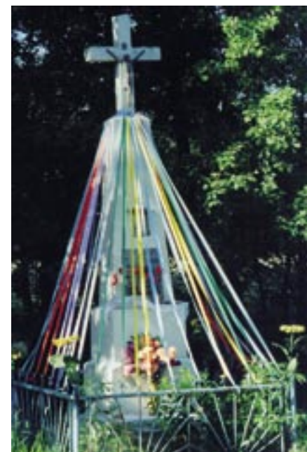
Kapliczka przy skrzyżowaniu z ulicą Nasielską z 1957 r.