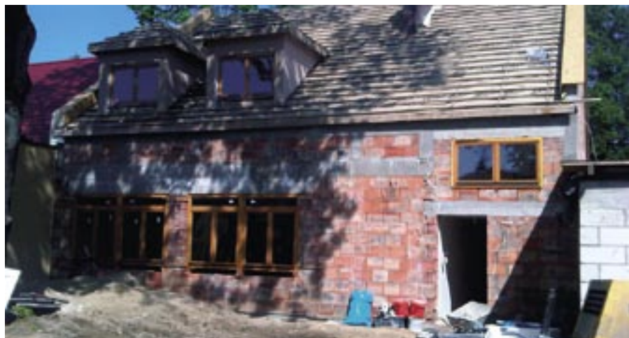
Rozbudowa Ośrodka Kultury w Serocku

W przygotowaniu jest postępowanie przetargowe na przebudowę wraz z budową zatok parkingowych i chodnika w Zegrzu przy ulicy Drewnowskiego. Zakres zamówienia obejmuje budowę jezdni drogi gminnej