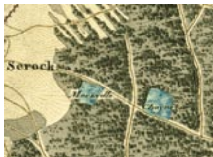
Fragment mapy z I połowy XIX w.