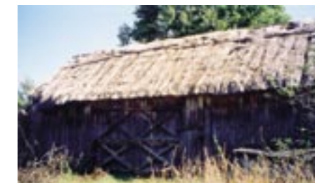
Ostatnia stodoła kryta strzechą u Stanisława Turka