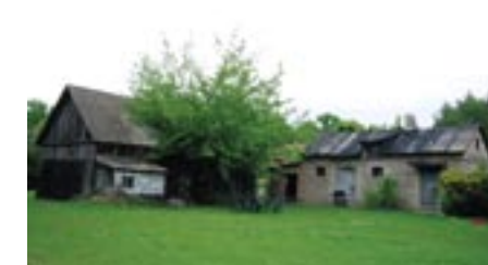
Budynki dawnego gospodarstwa pp. Sakowiczów