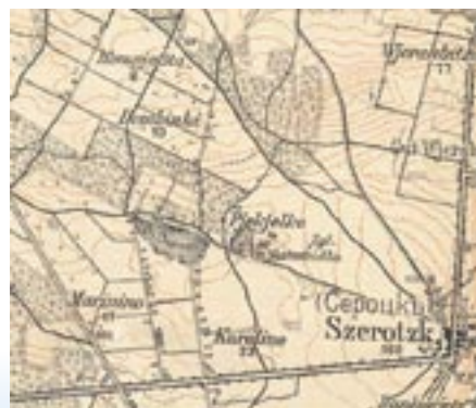
Moczydło na niemieckiej mapie z 1914 r.