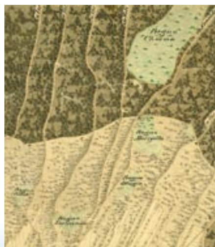
Fragment mapy z 1828 r. z Moczydłem

Jezioro Moczydło stanowi pozostałość po istniejącym dawniej dużym jeziorze, które powstało w końcowym okresie czwartorzęd, w holocenie. Jego zasięg można z łatwością odtworzyć analizując mapę z pierwszej połowy XIX w. Widać na niej wyraźnie, blisko siebie położone, cztery różnej wielkości jeziora - Chojno, Moczydło, Kostrzyniec i Długie. Jeszcze przed 30-40 laty zdarzały się takie okresy, kiedy te trzy ostatnie łączyły się ze sobą, zalewając na pewnym odcinku drogę zwaną „gościńcem”. Wielkie jezioro powstało