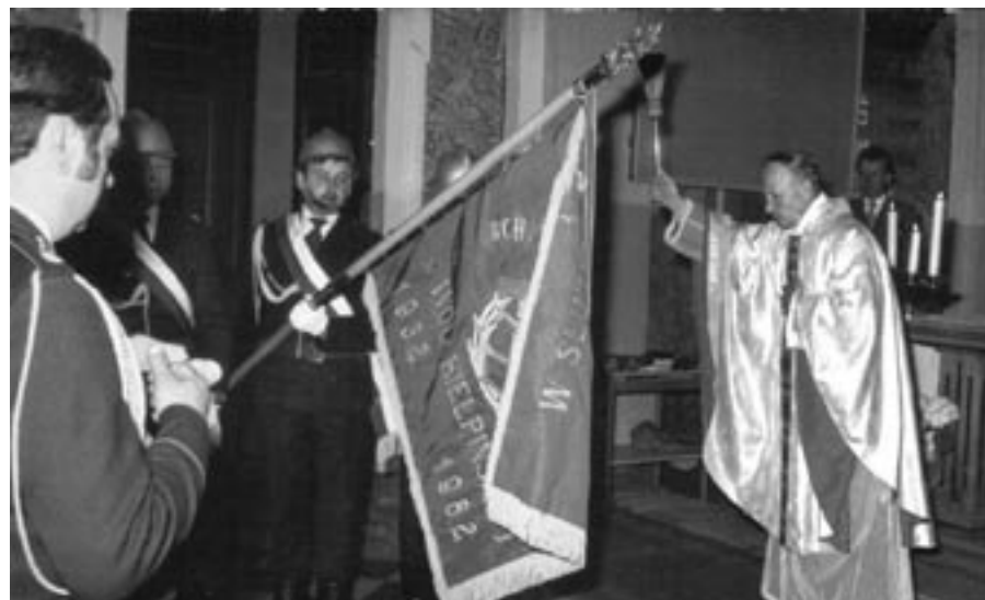
Poświęcenie sztandaru w roku 1982