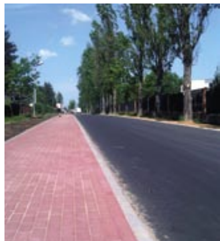
Przebudowa drogi gminnej w Jachrance

W tym miesiącu inwestycje na terenie miasta i gminy przebiegają sprawnie. Dość prędko rozwija się infrastruktura drogowa na terenie gminy. Rozpoczynając od przetargów - w trakcie oceny jest postępowanie na przebudowę drogi w Dębie. Zakres zamówienia obejmuje przebudowę jezdni i chodnika w pasie drogowym drogi gminnej Nr 180429W oraz jezdni w pasie drogowym drogi gminnej Nr 180721W w miejscowości Dęba. Ogółem zostanie wybudowane około 370 mb drogi oraz 407m 2 chodnika z kostki betonowej o grubości 6 cm. Budowa jezdni wraz z chodnikiem poprawi komunikację i stworzy bezpieczne i przyjazne warunki dla ruchu pieszego oraz pojazdów.