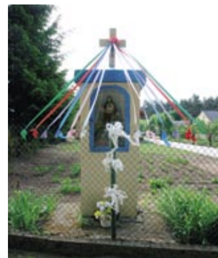
Figurka z 1966 r. ufundowana przez rodziny Jakubczaków i Turków