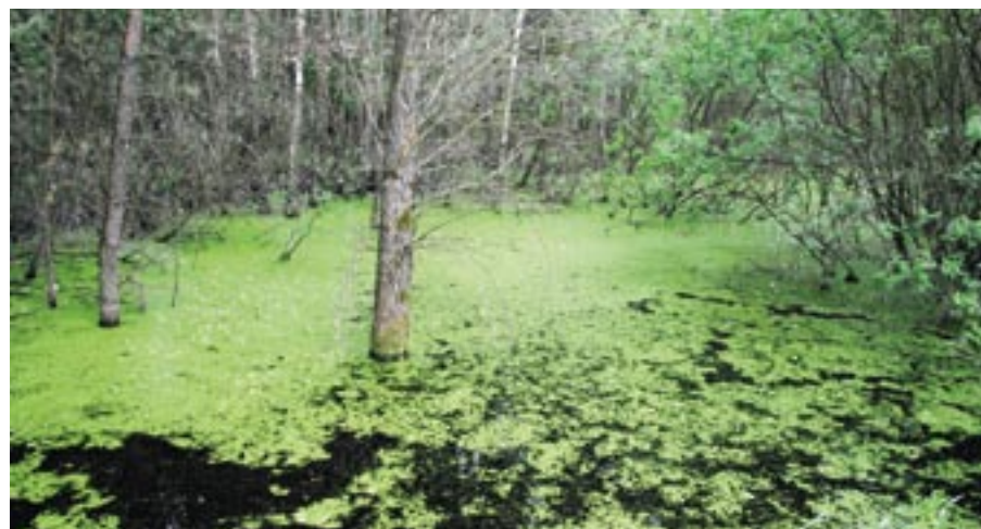
Jezioro zarosłe drzewami i krzewami

Położone w zachodniej części miasta - ulica i osiedle, nazwę swoją zawdzięczają jezioru, nazwanemu tak przez mieszkańców Serocka, którzy mogli w nim bezpiecznie moczyć len, co nie było możliwe w żeglownej Narwi.