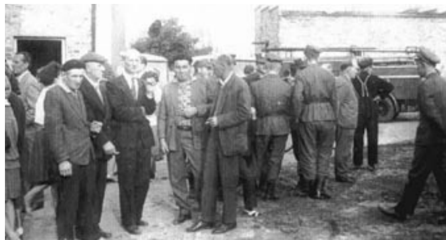
Zdjęcie „budowa remizy” przedstawia zawody w roku 1959