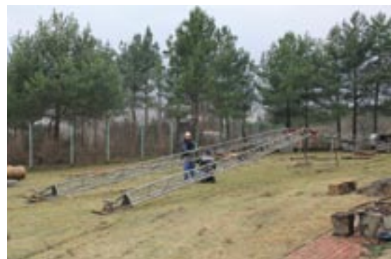
Rozpoczęcie prac związanych z modernizacją stacji wodociągowej w Wierzbicy