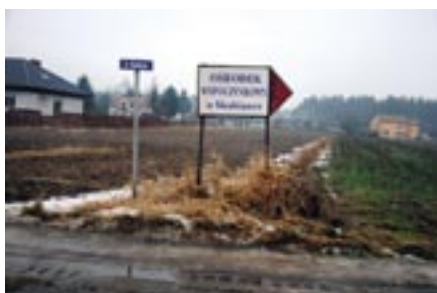
Ulica Baśniowa w Skubiance