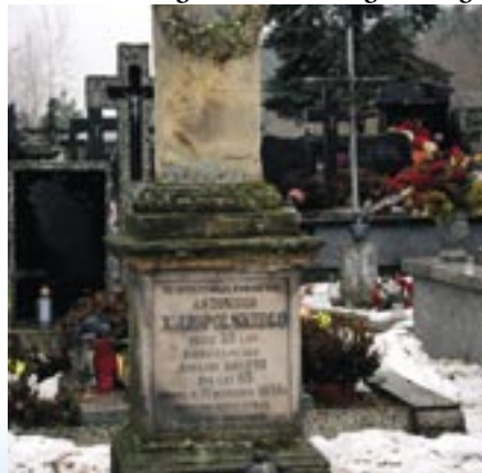
Nagrobek Antoniego Xięzopolskiego