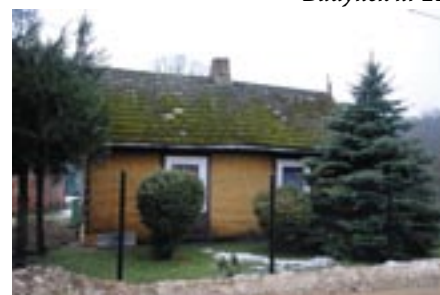
Budynek nr 25

Nazwa Skubianka pochodzi od czasownika skubać, znaczącego tyle co szczyścić i wrywać. Skubanie dotyczyło zaś pierza, wełny i włosów. Jest jeszcze jedno znaczenie tego słowa – okradać, ale w przypadku naszej miejscowości nie ma ono uzasadnienia. Stare słowniki języka polskiego – Bogumiła Lindego z początku XIX w., oraz Jana Karłowicza, Adama Kryńskiego i Władysława Niedźwieckiego znają też słowo skubanka, oznaczające wełnę lub tkaninę używaną zamiast waty i pierza do podszywania ubrań i do wypełniania poduszek, materaców kołder zimowych. Znane jest też słowo skubisko używane na określenie miejsca skubania. W moim przekonaniu nazwa Skubianka ma charakter topograficzny, a użycie rodzaju żeńskiego dla nazwy wsi jest typowe. Czyli pierwotnie nazwa byłaby używana na oznaczenie miejsca skubania wełny lub gęsi, a trzeba pamiętać iż wieś leżała na szlaku handlowym do Gdańska, a wełna i pierze były ważnymi towarami eksportowymi.