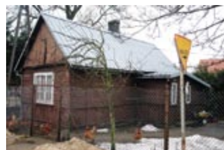
Budynek nr 5