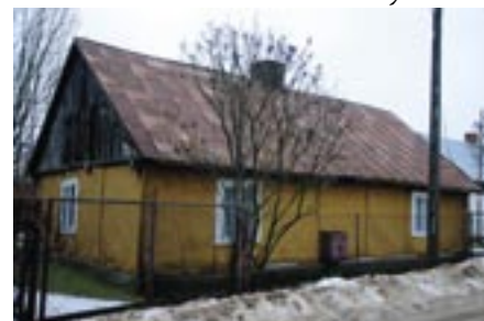
Budynek nr 21