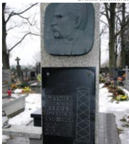
Nagrobek Witolda Zglenickiego