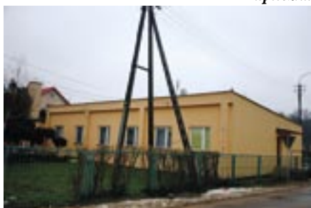
Budynek dawnej szkoły